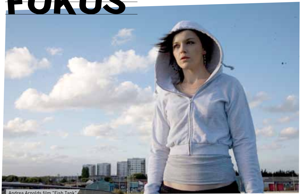
Andrea Arnolds film "Fish Tank"

– Jag hade hoppats på att se träden och skogarna, men har tyvärr inte hunnit än, säger Andrea Arnold om Sverigebesöket som hittills varit fullbokat för regissören, fredagen bestod av allt från middag till hemmafest, efter ett föregående Face2Face — där hon själv assisterade publiken med mikrofonen.