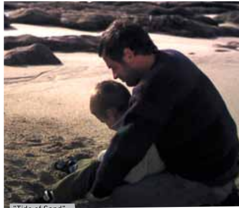
"Tide of Sand"