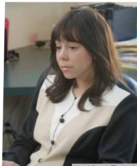
Mariah Carey in "Precious"