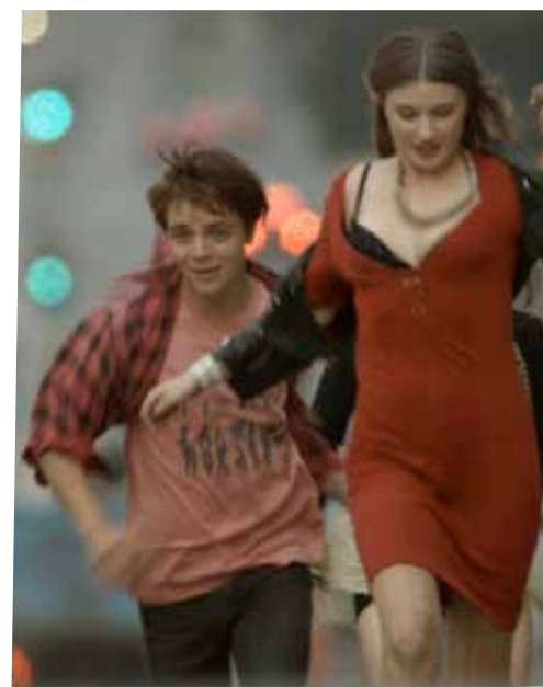
"Because the Night" visas som förfilm till "Miss Kicki"

– "Because the Night" utspelar sig under en ljummen sommarkväll som trasas sönder av diskoljus och öronbedövande musik. Fyra livsöden snuddar vid varandra, fyra väldigt olika personer söker varandras bekräftelse. Gemensamt har de att ingen av dem kan stanna hemma, de är sprängfyllda av både sorg och livsglädje. MATTIAS VESTIN